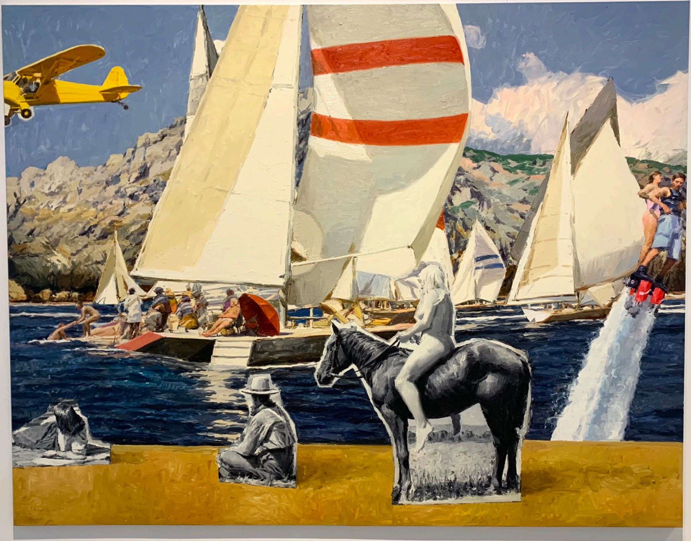
ESPERANDO LA REGATA, 2, 2023, ÓLEO SOBRE LINO, 258 X 337 CM