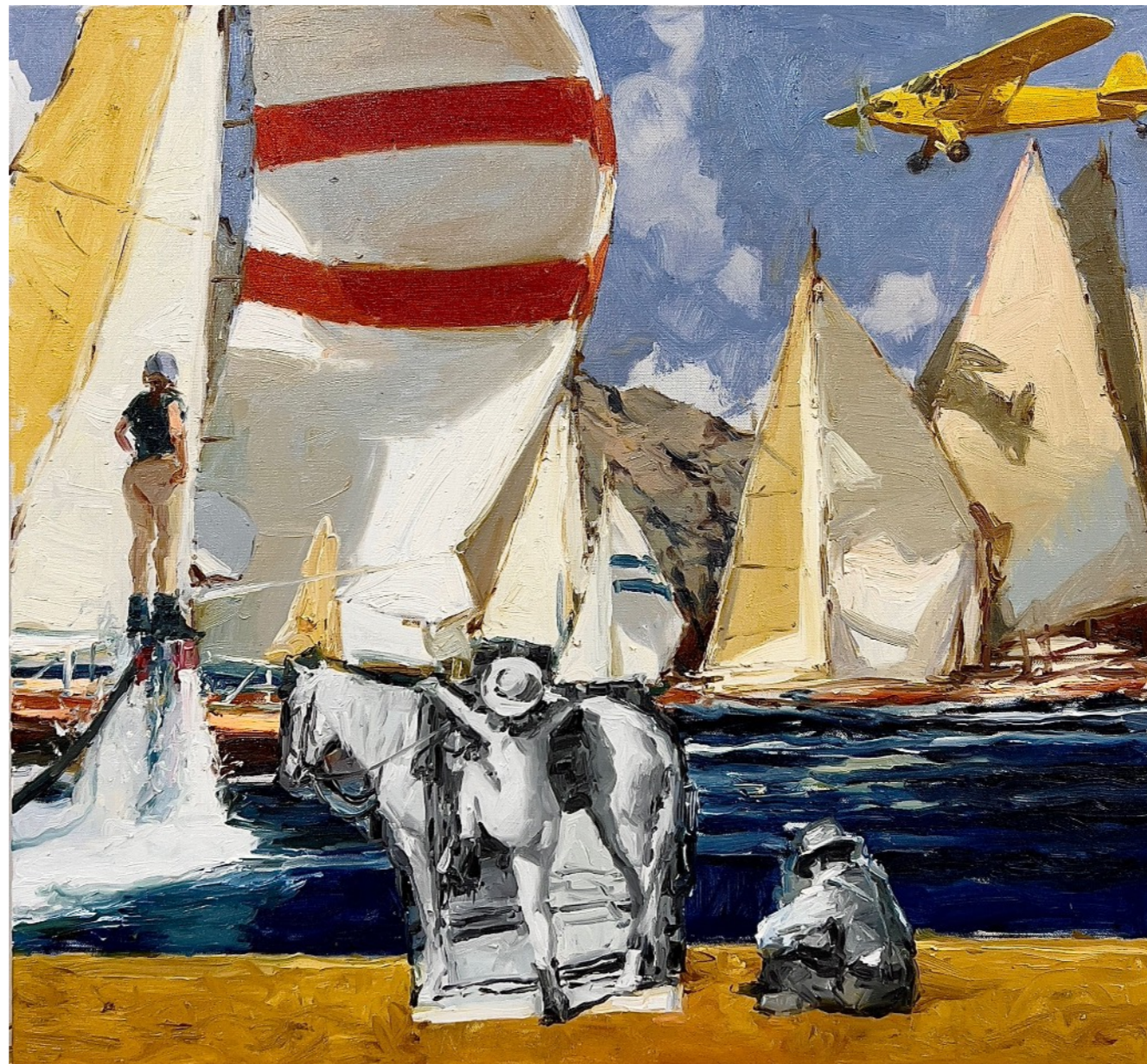
REGATA. ESCENA NO 1 2023 Óleo sobre lino 81,5 x 76 cm