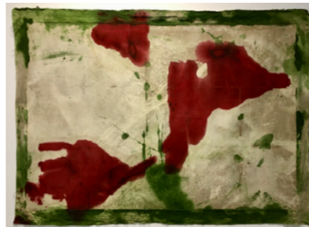
ANTONIO MURADO SIN TÍTULO

2020 Óleo sobre lino 220 x 305 cm GAA01-339