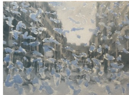
SIMON EDMONDSON SILVER LINING N°2

Carbón comprimido sobre papel 150 x 225cm GAA36-51