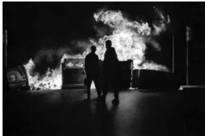
KEPA GARRAZA FIRE 3

Técnica mixta/cartón sobre madera 180 x 150 cm. GAA09-147