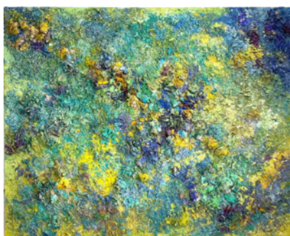
CRISTINA BABILONI LIGHT

2021 Técnica mixta sobre lino 190 x 140 cm. GAA64-48