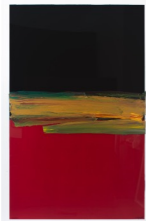
RAFAEL CANOGAR BAJEL 2021 Acrílico sobre metacrilato 150 x 100 cm GAA08-277