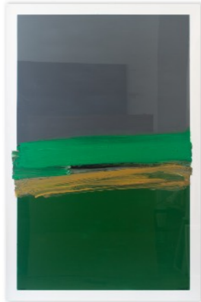
RAFAEL CANOGAR CORONA 2021 Acrílico sobre metacrilato 150 x 100 cm GAA08-275