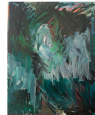
REBECA PLANA LANDSCAPE

2020 Óleo sobre lino 220 x 305 cm GAA01-339