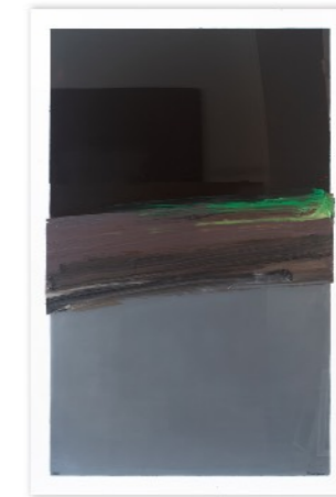
RAFAEL CANOGAR ARCA 2021 Acrílico sobre metacrilato 150 x 100 cm GAA08-276