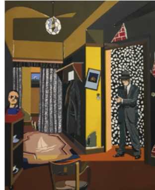
EDUARDO ARROYO DICHOSO QUIEN COMO ULISES II

1996 Técnica mixta, sacacorchos, corchos, botellas de cristal y hierro 200 x 50 cm GAA11-22