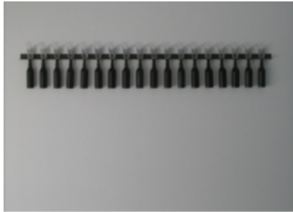
NACHO CRIADO TRASVASE (SACACORCHO)

1996 Técnica mixta, sacacorchos, corchos, botellas de cristal y hierro 200 x 50 cm GAA11-22