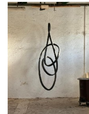
JOSE CHAFER Curvada XVIII

2022 Óleo sobre lienzo 152 x 210 cm GAA12-219