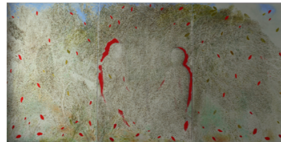
MARI PURI HERRERO CONVERSACIÓN (TRÍPTICO) 2019 Óleo sobre lienzo 140 x 200 cm GAA15-126