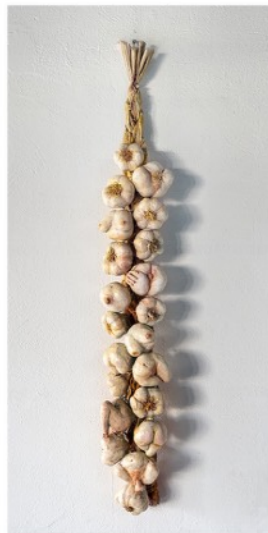
JOSÉ LUIS SERZO LA RISTRA DE COURBET 2022 Técnica mixta 105 x 13 x 17 cm GAA96-01